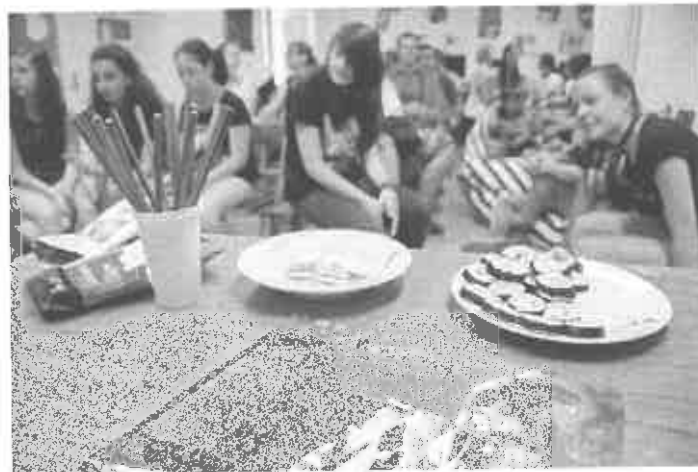
(életkép az Ázsia napról)

„A 2017-ben megrendezésre kerülő 3. Ázsia Nap nagyon nagy tömeget mozgató meg. Minden korosztályból voltak jelen. Érdekes programokkal és előadásokkal fogadtuk a nagyrészt. Bízunk benne, hogy ez az egész napos program már rendezvényé is kinőheti magát.”